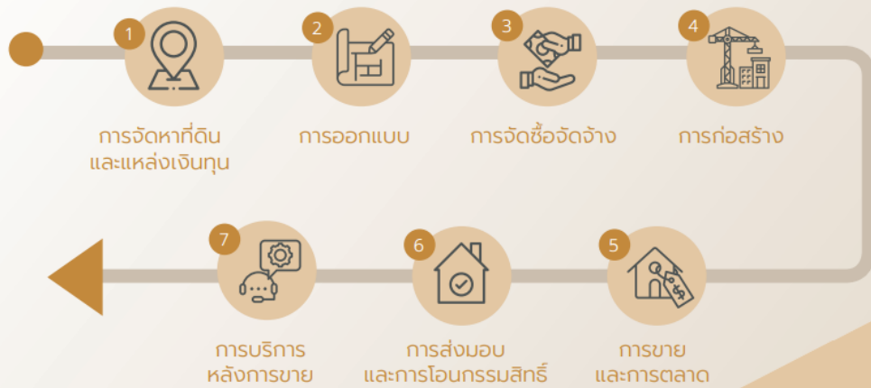
การจัดการผลกระทบต่อผู้มีส่วนได้เสียในห่วงโซ่คุณค่าของธุรกิจ

บริษัท ศุภาลัย จำกัด (มหาชน) มีการนำกระบวนการบริหารจัดการห่วงโซ่คุณค่ามาเป็นกลยุทธ์สำคัญในการดำเนินธุรกิจ เพื่อสร้างความยั่งยืนให้แก่ธุรกิจ และเพิ่มประสิทธิภาพในทุกกระบวนการทำงาน ตลอดจนห่วงโซ่คุณค่าโดยคำนึงถึงประโยชน์สูงสุดที่เกิดขึ้นกับผู้มีส่วนได้เสียทุกกลุ่มดังนี้